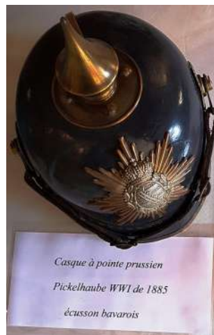
Casque à pointe prussien Pickelhaube WW1 de 1885 écusson bavarois