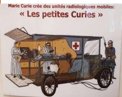
Marie Curie crée des unités radiologiques mobiles: « Les petites Curies »