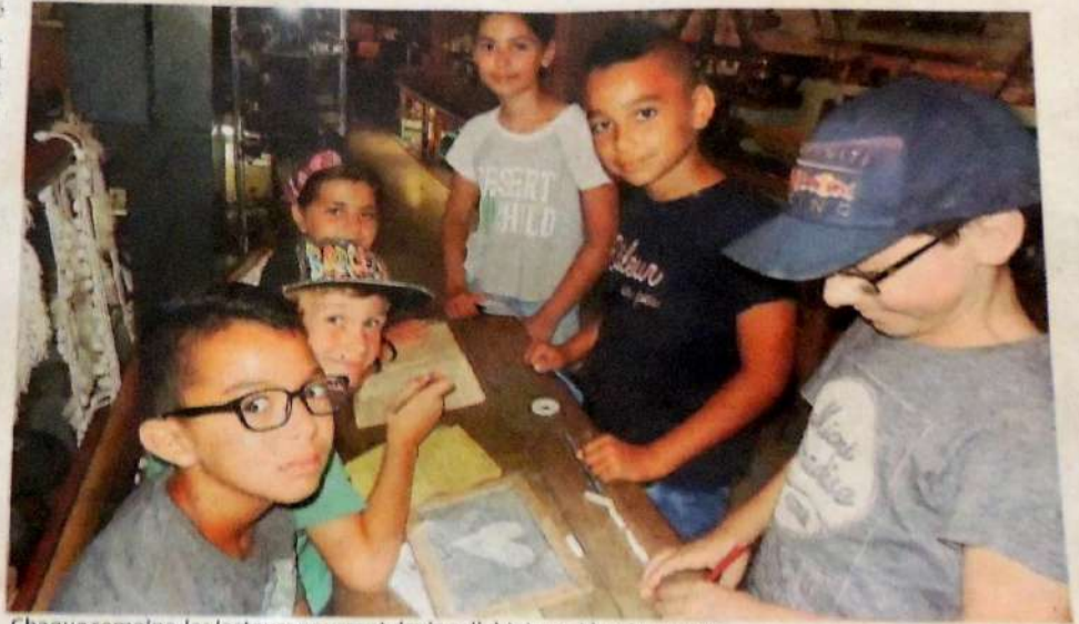
Chaque semaine, les lecteurs pourront deviner l'objet mystère.

Chaque semaine, dans les colonnes de l'édition locale, la photo d'un objet exposé au musée d'Auterive, métiers et traditions sera