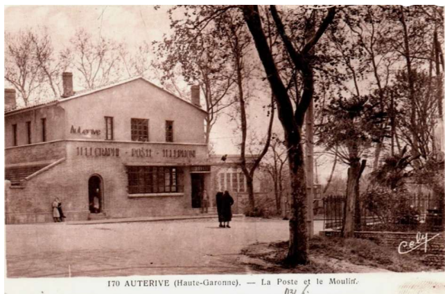
170 AUTERIVE (Haute-Garonne). — La Poste et le Moulin. 03/ 65