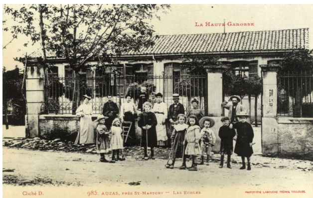
Cliché D. 985. AUZAS, PRÈS ST-MARTORY — LAS ÉCOLES PHOTOVIE LABOURE PÉREL TOULOUSE